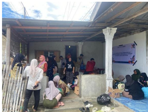
Gambar 1. Pelatihan Pendampingan kelompok wanita nelayan Nasinggeni

Melalui diskusi yang dilaksanakan setelah pelatihan, para wanita nelayan Nasinggeni memperoleh pemahaman mengenai aspek-aspek penting yang perlu diperhatikan dalam proses pembuatan produk, baik abon ikan marlin maupun sambal ikan tuna, termasuk pengelolaan pemasaran serta manajemen usaha. Hal ini berkontribusi pada peningkatan pengetahuan dan keterampilan mereka dalam produksi. Selain itu, tim pelaksana Program Kemitraan Masyarakat (PKM) Dosen dan Mahasiswa juga telah melakukan penyebaran informasi dan undangan terkait kegiatan pelatihan serta pendampingan kepada ibu rumah tangga nelayan Nasinggeni dan melibatkan tokoh masyarakat setempat untuk mendukung keberhasilan program.