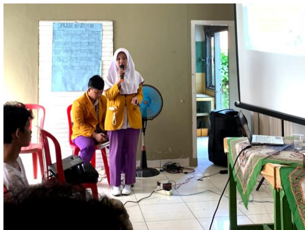
Gambar 1 Penyampaian Materi tentang Hipertensi

Hasil pelatihan menunjukkan bahwa seluruh peserta (16 orang) mampu mendemonstrasikan langkah-langkah pemeriksaan tekanan darah secara benar dan mandiri. Peserta juga mampu menjelaskan makna hasil pemeriksaan tekanan darah dan pentingnya deteksi dini terhadap risiko hipertensi. Melalui kegiatan ini, telah terbentuk 16 kader remaja sebagai peer educator yang siap menjadi agen perubahan dalam pencegahan hipertensi di lingkungan sekitarnya. Para kader ini diharapkan dapat menyebarluaskan informasi kesehatan kepada teman sebaya dan keluarga, serta berperan aktif dalam kegiatan Posyandu Remaja sebagai bentuk keberlanjutan program pemberdayaan masyarakat di Kelurahan Anggut Atas.