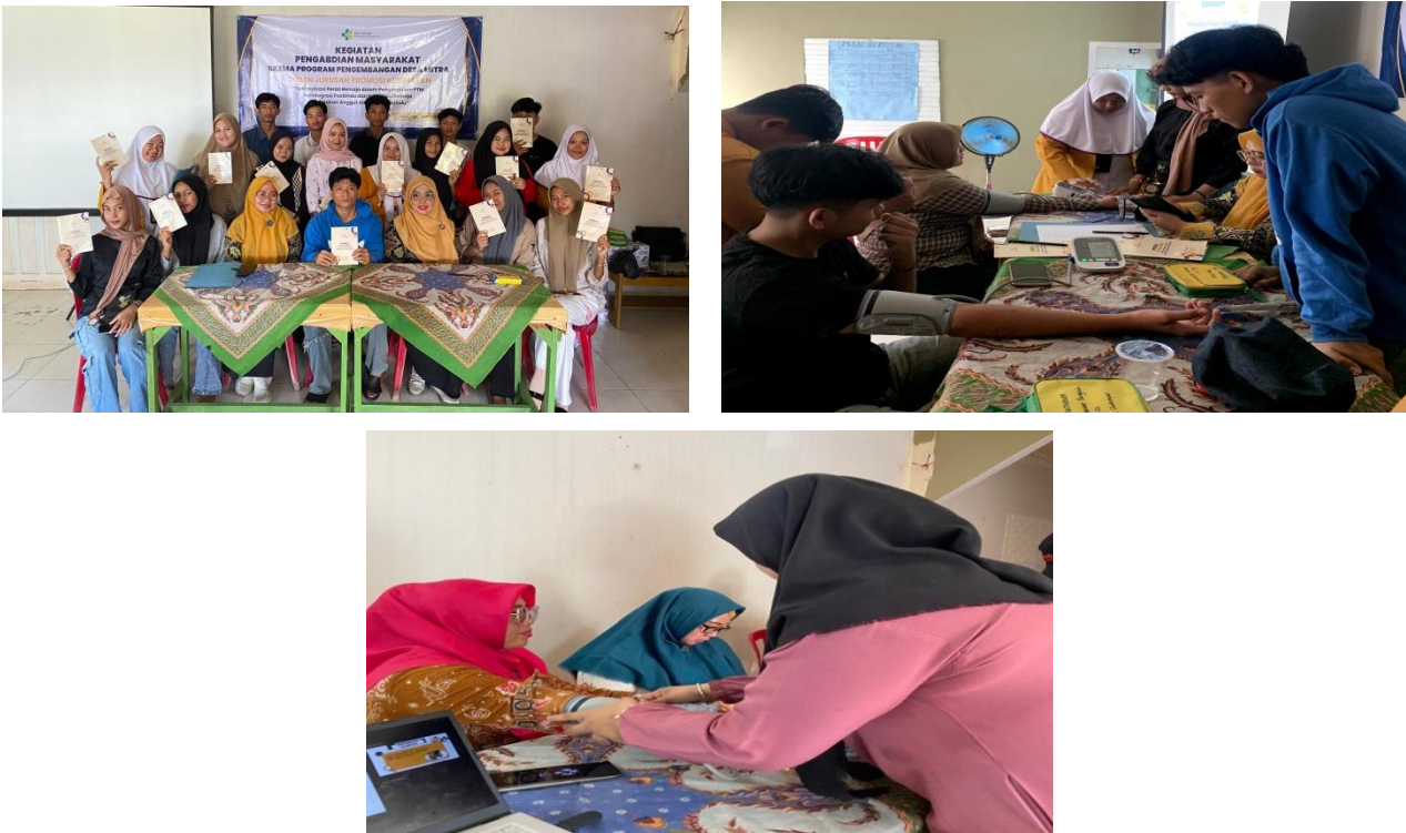
Gambar 2. Penyerahan Modul dan Pelatihan ke Kader Posyandu Remaja dalam Mengukur Tekanan Darah

Penyuluhan dilakukan sebelum memberikan pelatihan adapun materi yang diberikan berupa pengertian hipertensi termasuk klasifikasinya, faktor penyebab, tanda dan gejala, pencegahan, tips mengontrol hipertensi, pola makan, gaya hidup dan komplikasi.