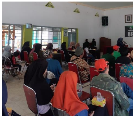
Gambar 2. Kelompok UMKM sebagai peserta kegiatan sosialisasi dan pendampingan sertifikasi produk halal

Kegiatan sosialisasi dilaksanakan pada hari Rabu tanggal 19 Juli 2023 bertempat di berjalan dengan lancar. Materi yang diberikan adalah asas-asas halal dan thoyib pada produk terkhusus pada berbagai ketentuan yang diatur dalam UU BPJPH No.33 tahun 2014, urgensi dan manfaat sertifikat halal bagi produk, serta peraturan pemerintah terkait aturan sertifikasi halal. Setelah kegiatan sosialisasi dilakukan, pelaku UMKM yang berjumlah 25 peserta yang terlibat dalam kegiatan tersebut mampu memahami tentang urgensi sertifikasi halal pada produk, meningkatkan wawasan pelaku UMKM mengenai pengaruh sertifikasi halal terhadap kepuasan pembeli, sekaligus mampu membentuk pemahaman serta pengalaman tentang langkah-langkah pengajuan sertifikasi halal. Tingkat peminat pendaftaran sertifikasi halal UMKM di desa Keling dan jumlah tingkat keberhasilan dalam mendapatkan sertifikasi halal digunakan sebagai capaian keberhasilan kegiatan. Hal ini dibuktikan dengan hasil data yang menunjukkan minat para pelaku UMKM yang mendaftarkan produk mereka pada sertifikasi halal sebanyak 20 orang yang kemudian hasil data tersebut kemudian dikirimkan penulis kepada Halal Center IAIN Kediri untuk proses selanjutnya dalam sertifikasi halal.