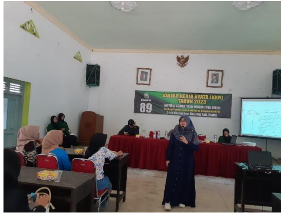
Gambar 1. Narasumber saat menyampaikan materi

Dengan demikian, terlaksananya sosialisasi dan pendampingan pelaku UMKM di Desa Keling, Kecamatan Kepung, Kabupaten Kediri dapat memahami manfaat dan pentingnya sertifikasi halal bagi produk untuk mengembangkan usahanya, sehingga langkah selanjutnya yaitu mampu meningkatkan kepercayaan konsumen serta kesejahteraan pelaku UMKM secara global. Kegiatan ini juga merupakan bentuk pengabdian masyarakat untuk membantu para pelaku UMKM dalam mempersiapkan produk pangannya dalam proses pengajuan sertifikasi halal dengan gratis melalui program Sertifikasi Halal Gratis (SEHATI).