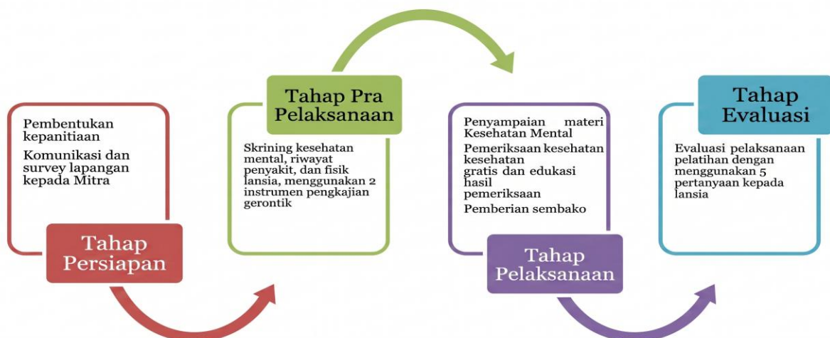
Gambar 1. Bagan Alur Pelaksanaan Kegiatan NUCLEUS