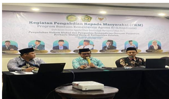
Gambar 4. Strategi BWI dalam Mendorong Legalitas dan Profesionalisme Nadzir Wakaf Uang di Kalimantan Selatan

Pada tahap action plan, peserta mulai merumuskan langkah konkret untuk meningkatkan profesionalisme nadzir di pesantren masing-masing, seperti penyusunan SOP sederhana, perencanaan pendaftaran nadzir ke BWI, serta pengembangan program wakaf produktif di bidang pendidikan dan ekonomi umat. Temuan ini menunjukkan bahwa pelatihan tidak hanya meningkatkan literasi regulatif, tetapi juga mendorong kesiapan peserta untuk bertransformasi dari pola pengelolaan wakaf tradisional menuju tata kelola nadzir yang legal, profesional, dan berkelanjutan (Yulianto et al., 2025).