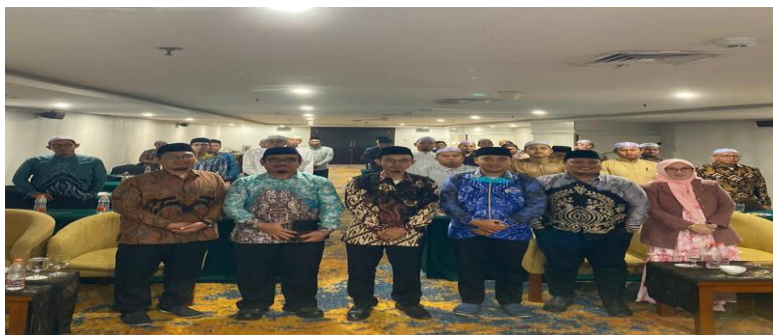
Gambar 5. Penyuluhan Hukum Wakaf dan Penguatan Kemandirian Ekonomi Pesantren Berbasis Wakaf Uang di Kalimantan Selatan

Dari aspek pengelolaan, pelatihan memperkuat pemahaman peserta mengenai konsep wakaf produktif, yaitu pengembangan aset wakaf tanpa mengurangi keutuhan pokoknya, sementara hasilnya disalurkan kepada mauquf 'alaih. Peserta dikenalkan pada rantai nilai agribisnis pisang Cavendish yang mencakup pembibitan, budidaya, panen, pascapanen, hingga pemasaran, serta pentingnya penerapan Good Agricultural Practices (GAP) untuk menjamin kualitas dan akses pasar yang lebih luas (Rahman & Hidayat, 2024). Pada tahap action plan, peserta diarahkan menyusun langkah konkret pemanfaatan tanah wakaf di pesantren masing-masing, meliputi pemetaan potensi lahan wakaf, penyusunan rencana bisnis sederhana, serta peninjauan kemitraan dengan pihak off-taker dan pemerintah daerah. Model kemitraan berbasis bagi hasil (profit-sharing) dipahami sebagai skema yang paling sesuai dengan karakter pesantren karena menjunjung prinsip keadilan dan keberlanjutan (Kamilah & Umam, 2025). Hasil diskusi juga menegaskan bahwa keberhasilan program ini sangat ditentukan oleh kapasitas nadzir dalam perencanaan, manajemen risiko, dan pelaporan keuangan wakaf sebagaimana diamanatkan dalam Undang-Undang Nomor 41 Tahun 2004. Dengan pengelolaan yang profesional dan dukungan pendampingan teknis, pemanfaatan tanah wakaf untuk perkebunan pisang Cavendish berpotensi menjadi model wakaf produktif yang aplikatif dan berkelanjutan bagi pesantren di Kalimantan Selatan.