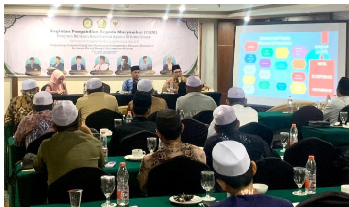
Gambar 3. Pelatihan Pengelolaan dan Pengembangan Wakaf Uang di Pondok Pesantren

Selain berdampak pada aspek ekonomi, hasil pelatihan menunjukkan bahwa wakaf uang dipahami sebagai instrumen penting dalam mendukung pembiayaan pendidikan pesantren, seperti beasiswa santri, honor tenaga pendidik, dan pengembangan sarana pembelajaran. Transformasi wakaf dari bentuk aset tetap menuju wakaf uang mencerminkan adaptasi pesantren terhadap perkembangan Islamic social finance yang lebih fleksibel dan inklusif (Ahmad Mujahidin, 2021).