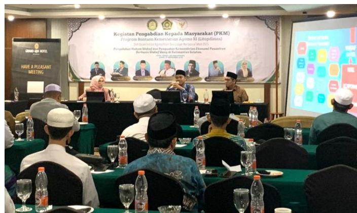
Gambar 2. Pelatihan Fiqh dan Regulasi Perwakafan di Indonesia

Secara keseluruhan, hasil pelatihan menegaskan bahwa peningkatan literasi fiqh dan regulasi wakaf berkontribusi pada kesiapan pesantren dalam mengelola wakaf secara profesional dan berkelanjutan, serta memperkuat peran wakaf sebagai instrumen pemberdayaan ekonomi pendidikan Islam (Ayub et al., 2024; Imawan & Syibly, 2020).