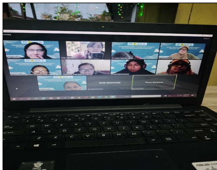
Gambar 1. Narasumber menjeaskan tentang power point