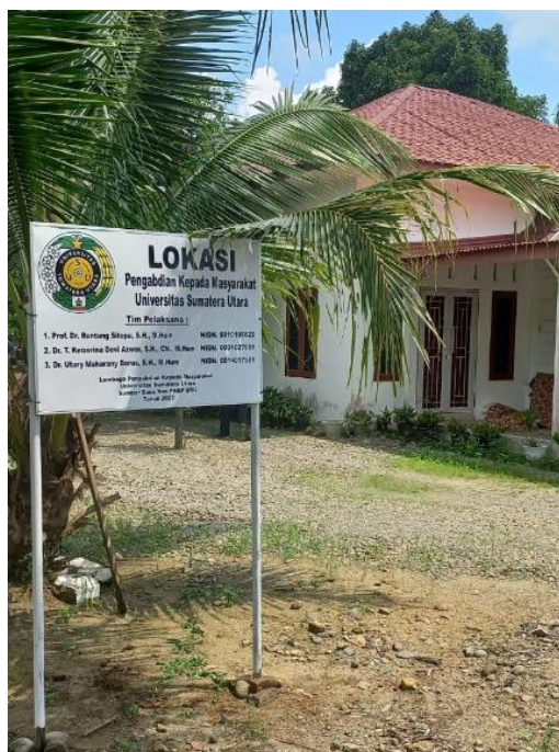
Gambar 2 Lokasi Pengabdian kepada Masyarakat

Melalui tahapan pelaksanaan tersebut, kegiatan pengabdian ini diharapkan mampu memberikan dampak nyata berupa peningkatan kesadaran hukum, penguatan kapasitas petani, serta perlindungan hak ekonomi petani Alpukat Lebak dan Markisa di Kabupaten Langkat secara berkelanjutan.