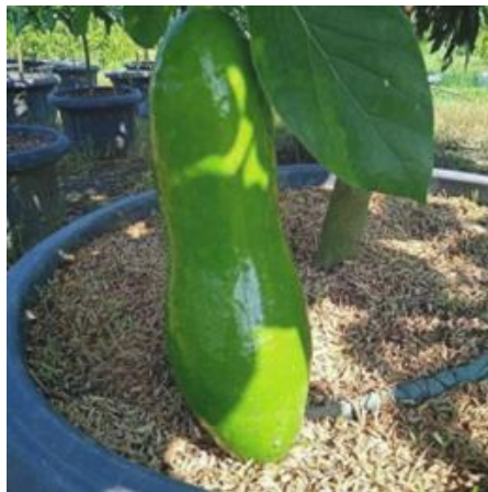
Gambar 3 Bentuk dan Tampilan dari Alpukat Lebak

Alpukat lebak dan markisa merupakan hasil pertanian yang sangat berpotensi yang ada di Desa Perdamaian, Kabupaten Langkat. Dimana terdapat 4 varian alpukat yang menjadi unggulan warga desa, yakni alpukat aligator, miki, pangeran dan lebak.