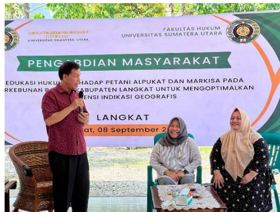
Gambar 4 Sosialisasi kepada Petani-petani di Perkebunan Rakyat Langkat

Salah satu hambatan utama yang dirasakan petani adalah anggapan bahwa proses pendaftaran Indikasi Geografis rumit dan memakan waktu lama. Dalam kegiatan ini, tim pengabdian berperan aktif menyederhanakan pemahaman petani terhadap tahapan pendaftaran. Tim membantu petani menyusun draf awal dokumen deskripsi Indikasi Geografis, menjelaskan komponen-komponen penting yang harus dipenuhi, serta memberikan simulasi pengisian dokumen secara bertahap. Selain itu, tim pengabdian juga memfasilitasi pemahaman petani mengenai pentingnya dukungan pemerintah daerah dalam proses pendaftaran, sehingga MPIG diarahkan untuk menjadi mitra strategis pemerintah daerah dalam pengajuan Indikasi Geografis. Pendekatan ini mengubah persepsi petani bahwa pendaftaran Indikasi Geografis bukanlah proses yang tertutup dan sulit, melainkan dapat dilakukan secara bertahap dan kolektif.