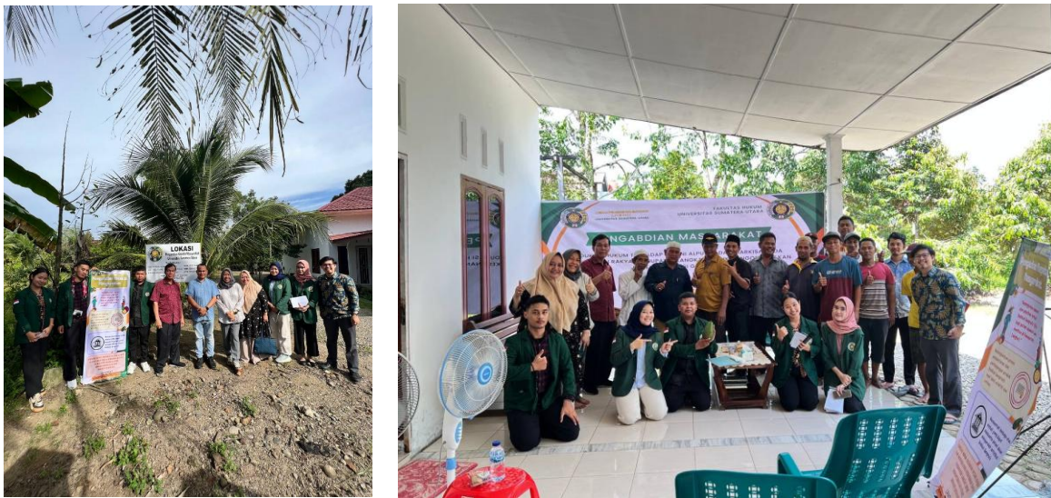
Gambar 6 Edukasi Hukum bagi Petani Tentang Kesadaran dan Kemampuan Mereka untuk Memaksimalkan Potensi Indikasi Geografis pada Produk Alpukat dan Markisa.

Solusi berikutnya ialah memberikan edukasi hukum yang intensif dan terarah kepada petani alpukat lebak dan markisa tentang pentingnya Indikasi Geografis (IG) dan hak-hak mereka terkait dengan Indikasi Geografis, Memperbaiki proses pendaftaran dan penerbitan sertifikat Indikasi Geografis yang lebih efektif dan efisien, serta memberikan edukasi alternatif penyelesaian sengketa yang mudah dan efektif bagi petani terkait dengan hak-hak mereka terkait dengan Indikasi Geografis.