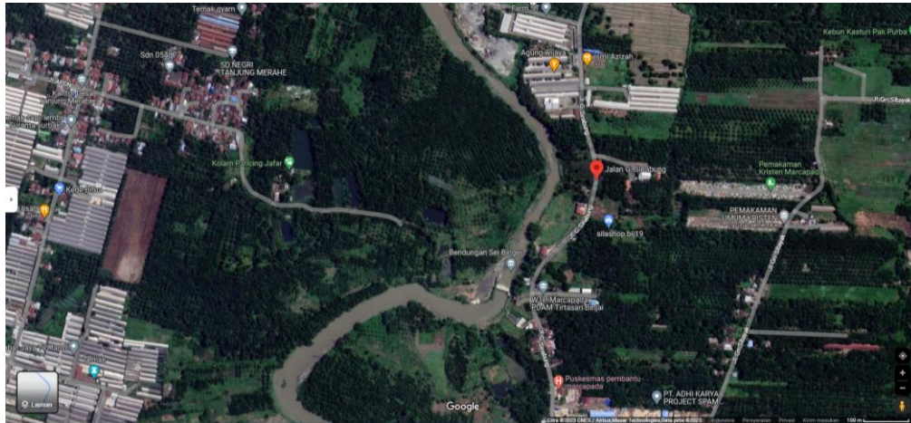
Gambar 1 Titik Koordinat Lokasi Pengabdian kepada Masyarakat

Lintang Utara dan 97°52'00' – 98° 45'00" Bujur Timur. Yang memiliki luas wilayah seluas 6.263.29 Kilometer persegi yang terbagi menjadi dua puluh tiga kecamatan. Hasil perkebunannya berupa karet kering (karet), daun kering (teh dan tembakau), biji kering (kopi dan coklat), kulit kering (kayu manis dan kina), serat kering (rami), bunga kering (cengkeh), refined sugar (tebu dari perkebunan besar), gula mangkok (tebu dari perkebunan rakyat), ekivalen kopra (kopra), biji dan bunga (pala) serta minyak daun (sereh). (Langkat, 2023) Salah satu potensi indikasi geografis di Kabupaten Langkat tersebut adalah potensi hasil kebun buah-buahan yang tumbuh subur diberbagai daerah.